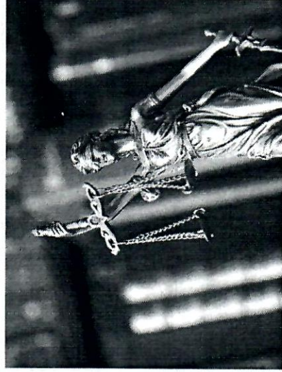
Памятка подготовлена отделом по надзору за исполнением федерального законодательства прокуратуры Вологодской области.

- в прокуратуру Вологодской области по адресу: 160035, Вологодская область, г. Вологда, ул. Пушкинская, д. 17, либо через Интернет-приемную на официальном сайте prokvo1ogda.ru .